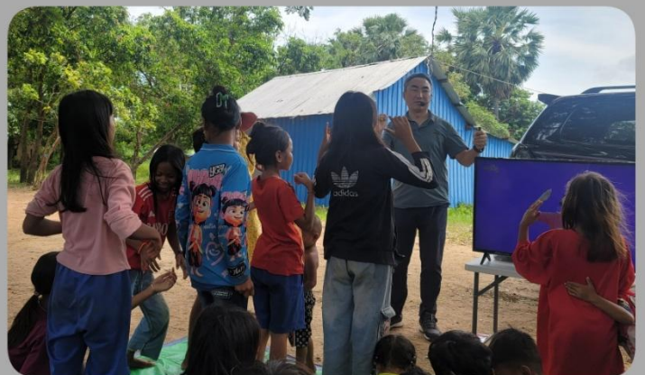
점벽플루어 마을 한국어 교육