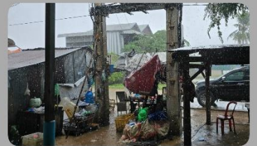
틀록엥그롱 마을 주일예배