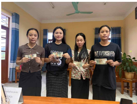
장학금을 받은 학생들

고산지역 출신의 학생들 중 몽족, 끄무족 여학생들은 15-16세가 되면 결혼을 하며, 결혼에 이은 임신과 출산 때문에 여학생들은 자연스럽게 학교를 떠나게 됩니다. 배움을 통해 꿈을 키우고 미래를 준비해야 하는 중요한 시기에 이 여학생들은 인생의 중요한 갈림길에 놓입니다. 학생으로 학업을 이어갈 것인가? 아니면 부모님의 바람대로 결혼을 할 것인가?