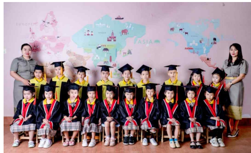
23회 딘디유치원 졸업생

지난 5월 22일 딘디유치원 제 23회 졸업식이 있었습니다. 그동안 4-5년 동안 딘디유치원에서 함께 자라고 배웠던 어린 학생들 19명(여학생 12명, 남학생 7명)은 이제 유치원 과정을 마치고, 새학기를 시작하는 오는 9월에 딘디초등학교로 진학할 예정입니다.